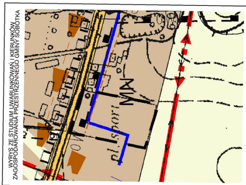
WYRYS ZE STUDIUM UMARUNKOWAŃ I KIERUNKÓW ZAGOSPODAROWANIA PRZESTRZENNEGO GMINY SOBÓTKA

14.05.2022/2022 DOKŁAD OPISOWY: 14.05.2022, 14.05.2022, 14.05.2022 DOKŁAD WYKONAWCZY: 14.05.2022, 14.05.2022, 14.05.2022 DOKŁAD WYKONAWCZY: 14.05.2022, 14.05.2022, 14.05.2022