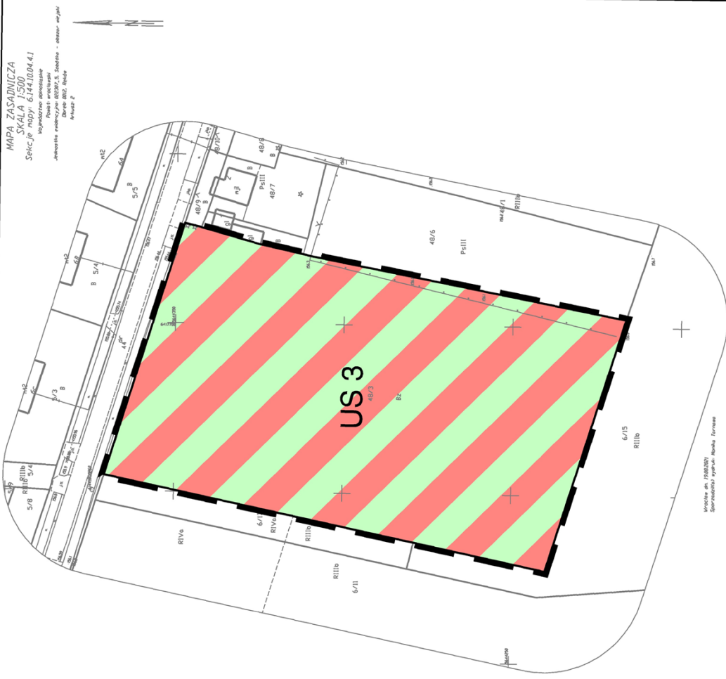
MAPA ZASADNICZA SKALA 1:500 Siecicje mapy: 6.144.1004.4.1 Wykonano w: Sobótka Dzielnica: Sobótka Dzielnica: Sobótka Dzielnica: Sobótka Dzielnica: Sobótka Dzielnica: Sobótka